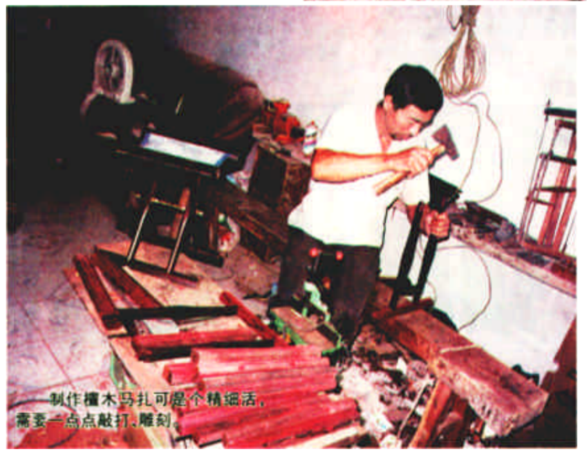
制作榿木马扎可是个精细活，需要一点敲打、雕刻。