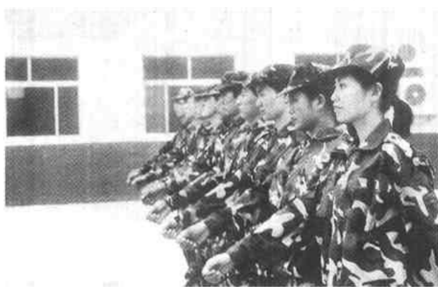
城市管理行政执法局河口分局于近日成立。为城市管理的执法队伍逐步建成一支政治可靠、业务过硬、作风顽强、市民拥护的文明之师，他们实行军事化管理，经常性地进行思想、纪律、作风和法制的专门教育。 图为工作人员正在进行岗前军训。