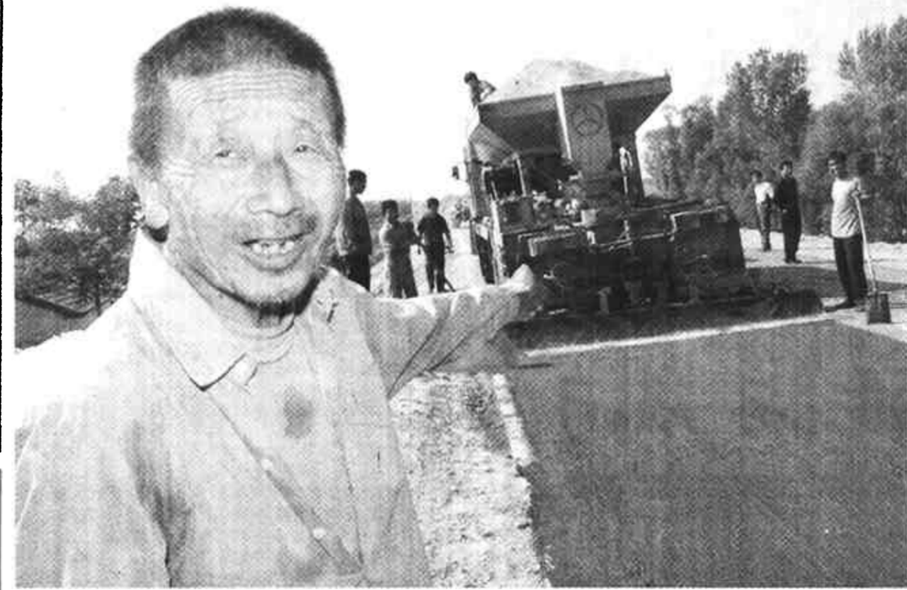
东营区龙居镇党委、政府认真实践“三个代表”重要思想，积极为群众办实事、办好事。最近，该镇多方筹集资金1300万元，修通了展区堤顶公路。这条全长12公里的堤顶柏油路，使19个村11000人受益，深得民心。