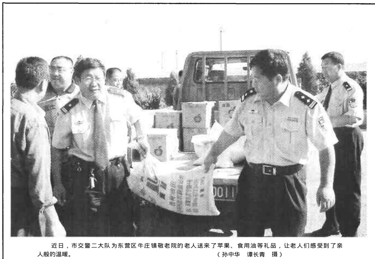
近日,市交警二大队为东营区牛庄镇敬老院的老人送来了苹果、食用油等礼品,让老人们感受到了亲人的温暖。