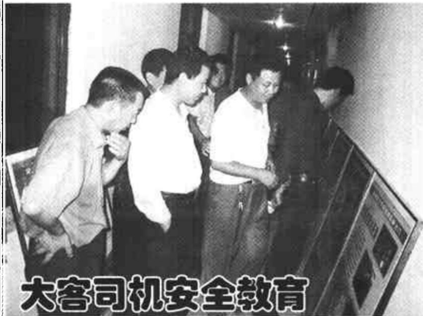
大客司机安全教育

9月22日晚，东营交运公司会议室里济济一堂，225名长途客车司机在这里共同学习了交通安全知识。这是东营交警支队直属二大队为了确保节日期间交通安全而采取的教育宣传措施。图为司机们正在观看交通事故展览。